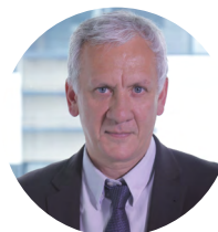
Animé par Jean-François Tardiveau Rédacteur en Chef, L'Agefi Actifs